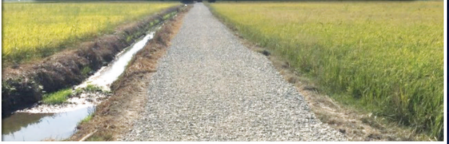
โครงการปรับปรุงซ่อมแซมถนน โดยการลงหินคลุกพร้อมปรับเกลี่ยเรียบ หมู่ที่ ๓