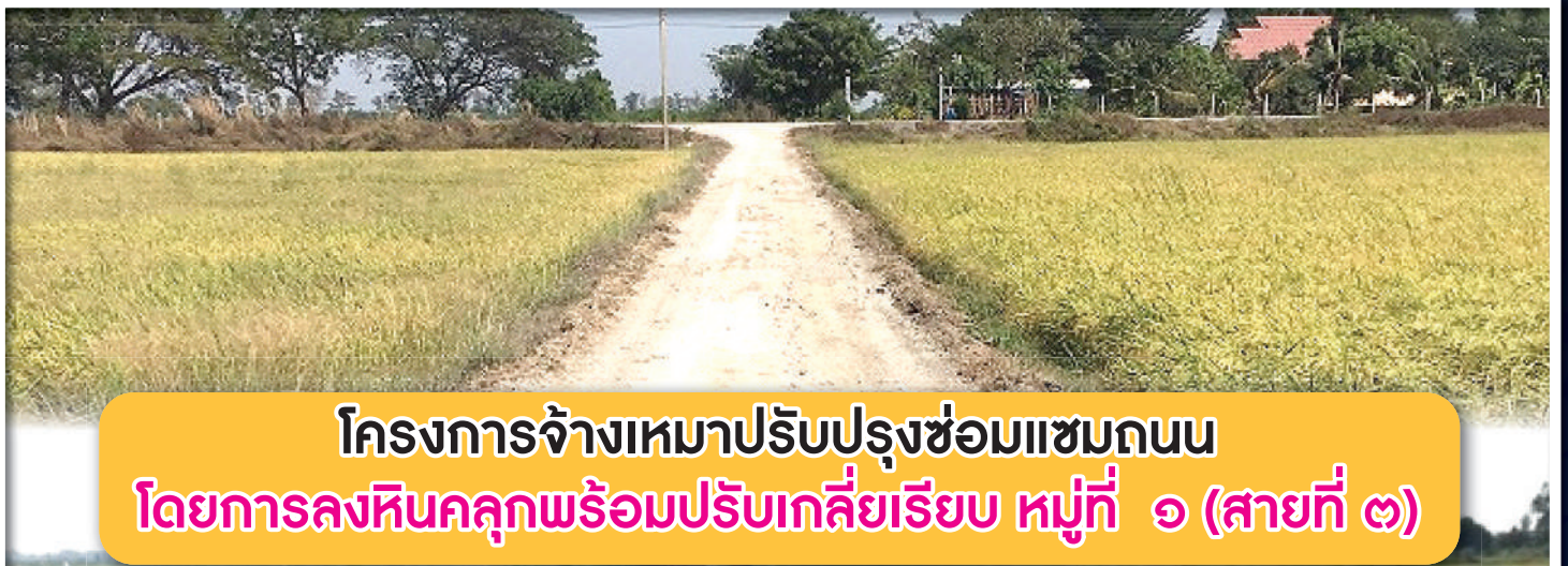
โครงการจ้างเหมาปรับปรุงซ่อมแซมถนน โดยการลงหินคลุกพร้อมปรับเกลี่ยเรียบ หมู่ที่ ๑ (สายที่ ๓)